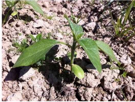
Stade 2 paires de feuilles, apparition de la 3 ème paire : stade idéal pour déclencher les désherbages mécaniques en plein

Précautions complémentaires concernant la gestion des adventices en culture :